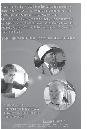
このDVDは6つのストーリーで構成されており、それぞれ異なる障害レベルと受傷歴の6名が、どのように障害を乗り越え、現在どのような日常生活を送っているかを語っている。

自ら会社を作った人、スポーツで世界を目指す人、家族と共に子育てに奮闘する人など、様々な視点から夢や目標に向かって自分らしく進み続けていることの意味や楽しさを伝えてくれる。